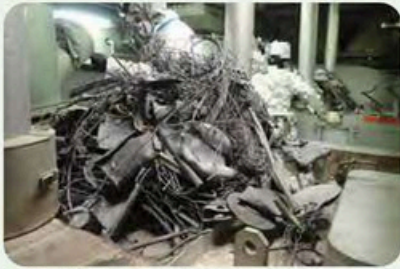
焼却炉から出てきた不燃物

金属・陶器・ガラスごみが原因で、令和3年度から令和5年度にかけての3年間で、焼却炉が3回停止してしまいました。