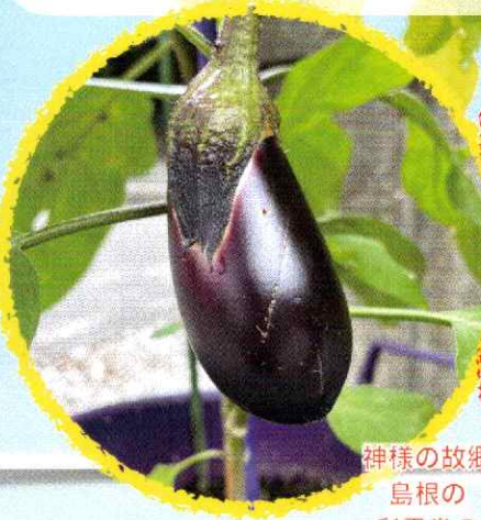
神様の故郷 島根の 彩雲堂の お菓子♪

本年も、雑司が谷大鳥神社で「雑司が谷ナスと鎮守の市」を開催します。 ぜひお楽しみください！