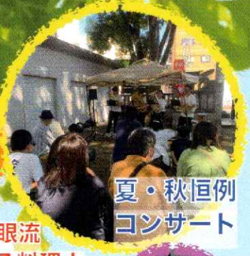
夏・秋恒例 コンサート